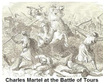
Charles Martel at the Battle of Tours

Slaget slog hål på de franska och de burgundiska styrkorna som leddes av Charles Martel Austrasian (ålderdomligt för österrike) mot en armé av Umayyad kalifatet som leddes av 'Abdul Rahman Al Ghafiqi, guvernör och general av Andalusien. Fransmännen var segerrika, 'Abdul Rahman Al Ghafiqi dödades, och Charles kunde därefter utöka sin makt i söder. Åttahundratalets krönikörer, som tolkade utgången av slaget som ett gudomligt utslag till sin fördel, gav Charles smeknamnet Martellus ("hammaren"). Detaljer om slaget, inklusive dess lokalisering och det exakta antalet kämpande, kan inte bestämmas från redovisningar från dem som hade överlevt; Framför allt vann de franska trupperna slaget utan kavalleri.